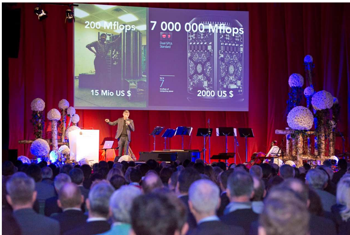
Gastreferent Ranga Yogeshwar zum Thema: "Nächste Ausfahrt Zukunft - Unser Umgang mit dem Neuen"